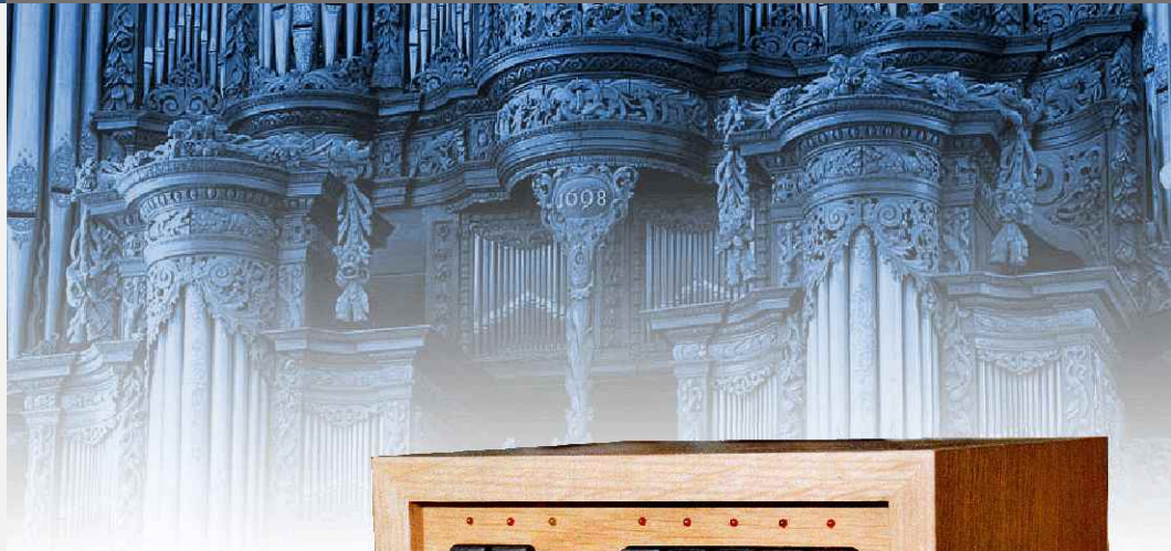
SE-5 in heller Eiche